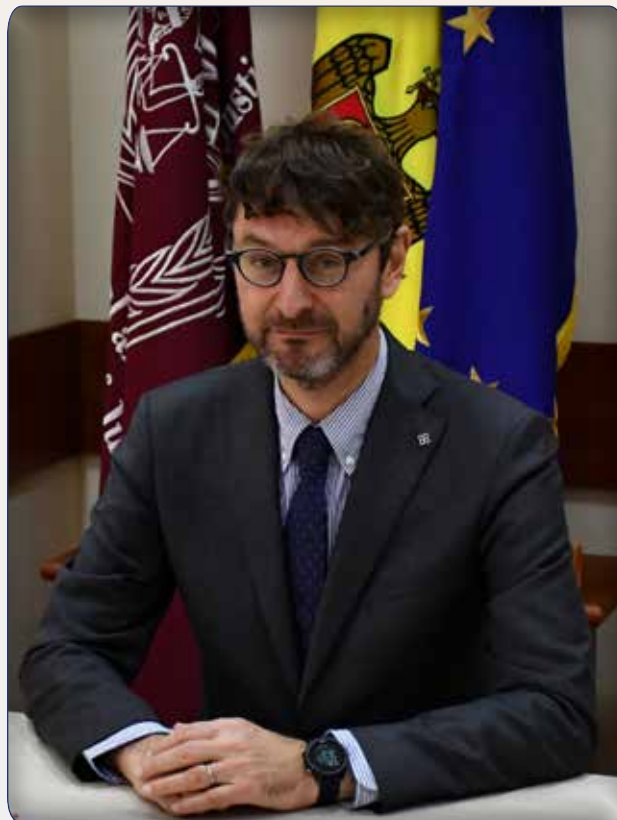
Pierre DE MONTE, Magistrat de legătură din cadrul Ambasadei Franței la București cu competențe pentru Republica Moldova și România

– Să știți că, chiar în primul an de activitate, conducerea și șefii subdiviziunilor Institutului Național al Justiției au mers la Paris pentru a prelua experiența avansată a Școlii Naționale de Magistratură din Franța în organizarea procesului